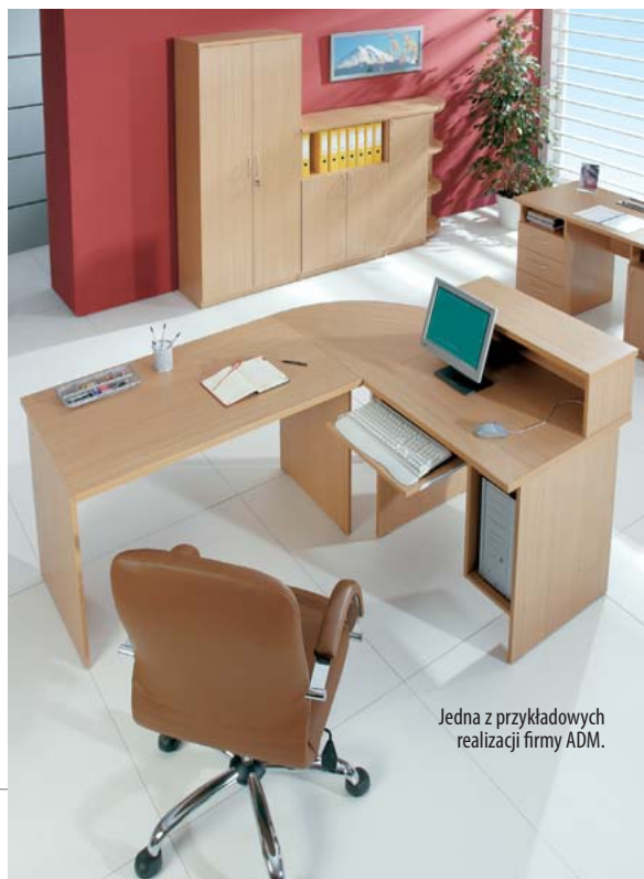
Jedna z przykładowych realizacji firmy ADM.

Absolutną nowością firmy Toba jest system mebli pracowniczych „Noter”, wprowadzony do oferty w październiku br. To meble proste, stabilne i dopasowane do potrzeb w niemalże każdym detalu.