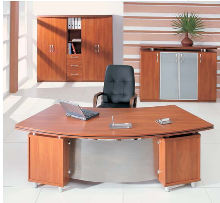
W ofercie firmy ADM są m.in. meble gabinetowe. Na zdjęciu jedna z przykładowych aranżacji.